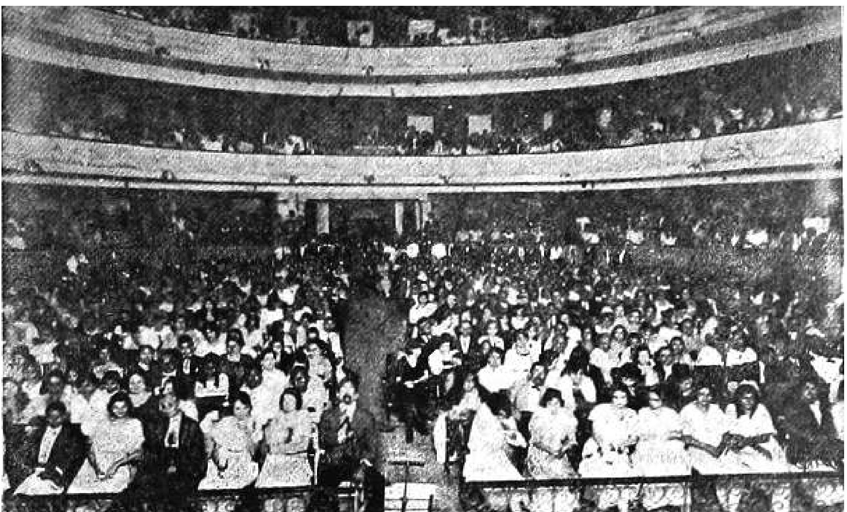
El Popular , 3 de diciembre de 1921. Año. 1, número 42.

De esta forma inició con el pie derecho la gestión pública de Felipe Carrillo Puerto, aunque faltaba un poco para que asumiera la gubernatura de Yucatán. Este fue uno de los elementos que le permitió desarrollar el proyecto educativo racionalista, ya que principal responsable de la educación en México había visto con buenos ojos lo que estaba por venir.