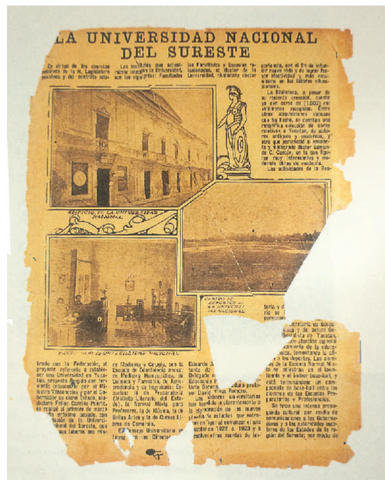
Imagen de una de las publicaciones periódicas de la Universidad Nacional del Sureste de 1925.