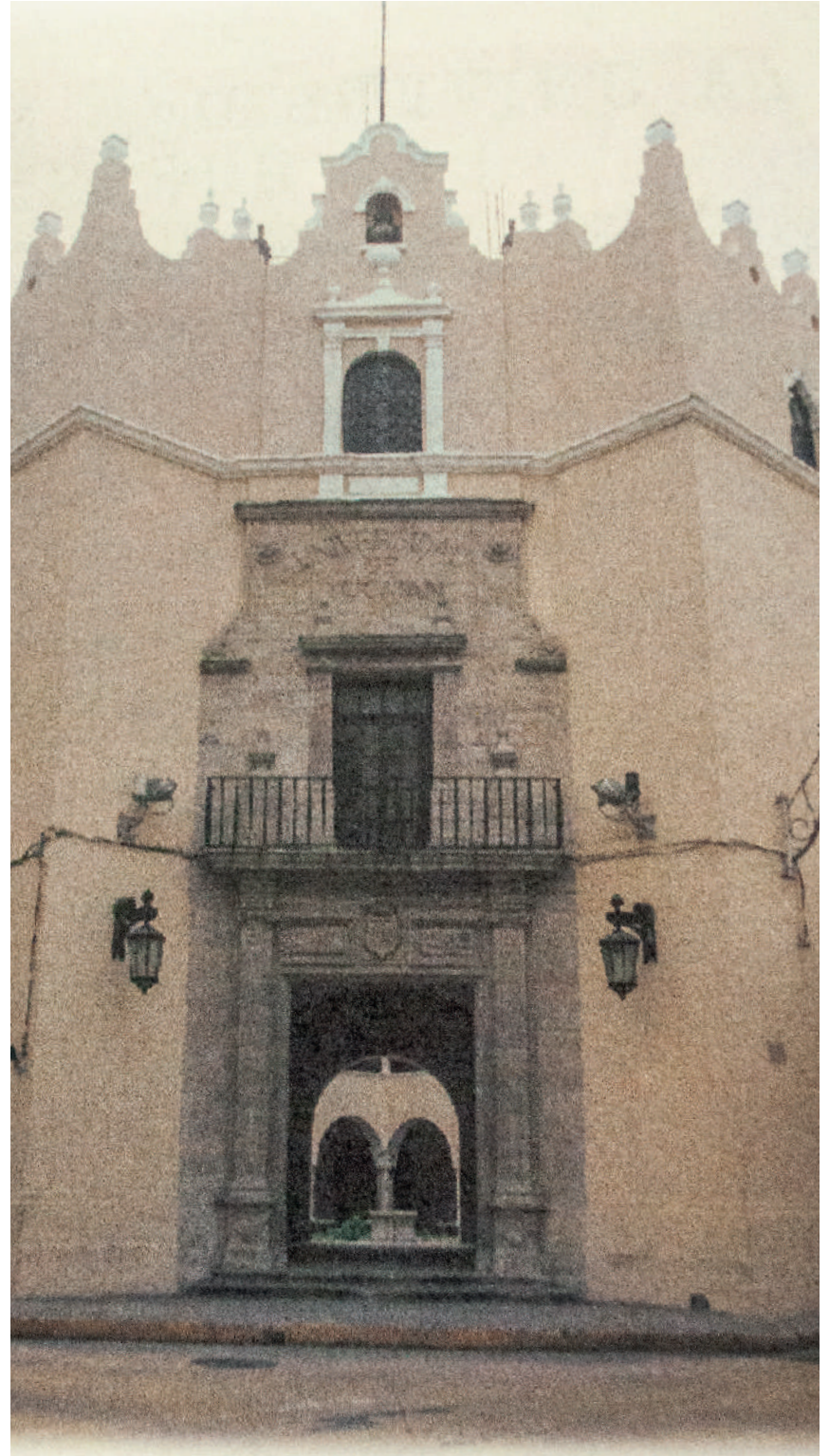
Fachada actual del edificio de la Universidad Autónoma de Yucatán.

acordes con la aspiración de construir una sociedad cada vez más justa, igualitaria y libertaria. Legítimas aspiraciones a las que todavía falta impulsar y consolidar a la comunidad universitaria para respetar y enaltecer su genuina esencia primigenia.