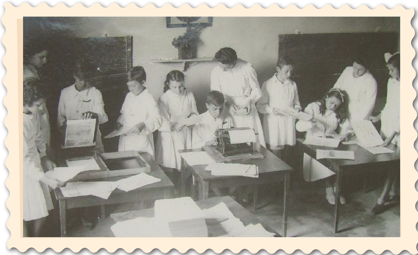
“Escuela Racionalista en México”.

E n 1917 una escuela en la península de Yucatán fue señalada de inverosímil. No obstante, nadie hubiera pensado que en sus actividades se experimentó una serie de ideas, propuestas y experiencias modernas, simultáneas en Europa y radicales a su tiempo. La Escuela Racional de Chuminópolis fue una práctica educativa que tuvo como objetivo la formación del niño en un ambiente propicio para su desarrollo natural, en un micro universo social y económico en el cual no existirían las clases.