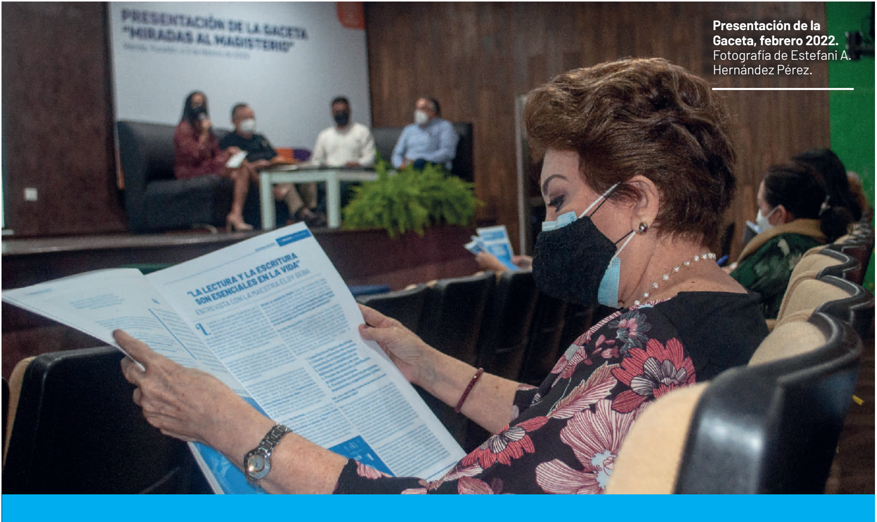
Presentación de la Gaceta, febrero 2022.