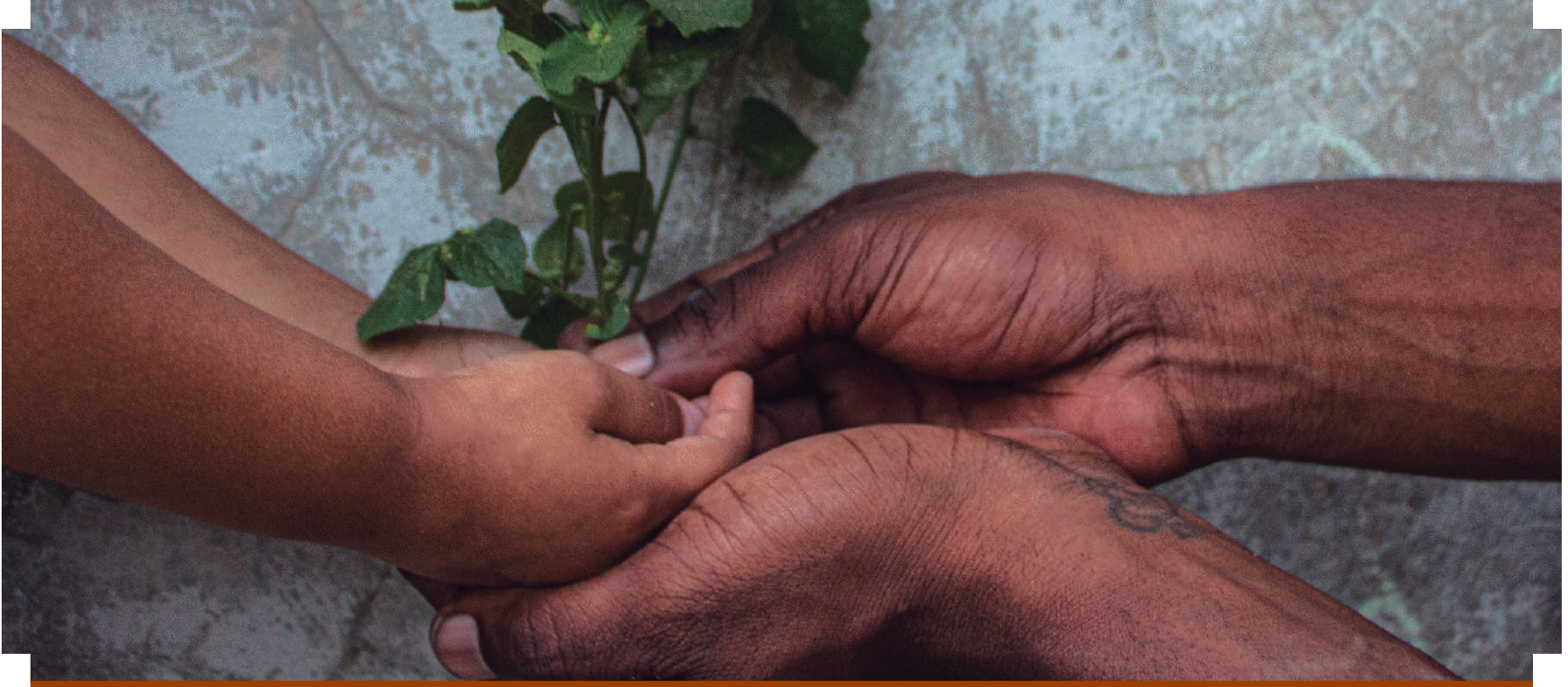
"Raíces Afro", febrero 2022.

P ara muchos lectores, maestros, funcionarios, o público en general, el tema de los afrodescendientes en el país les será desconocido porque fuimos educados con la idea de que "en México no hay negros". Esta "verdad" se ha reforzado con la añeja propuesta de un México producto de españoles e indígenas.