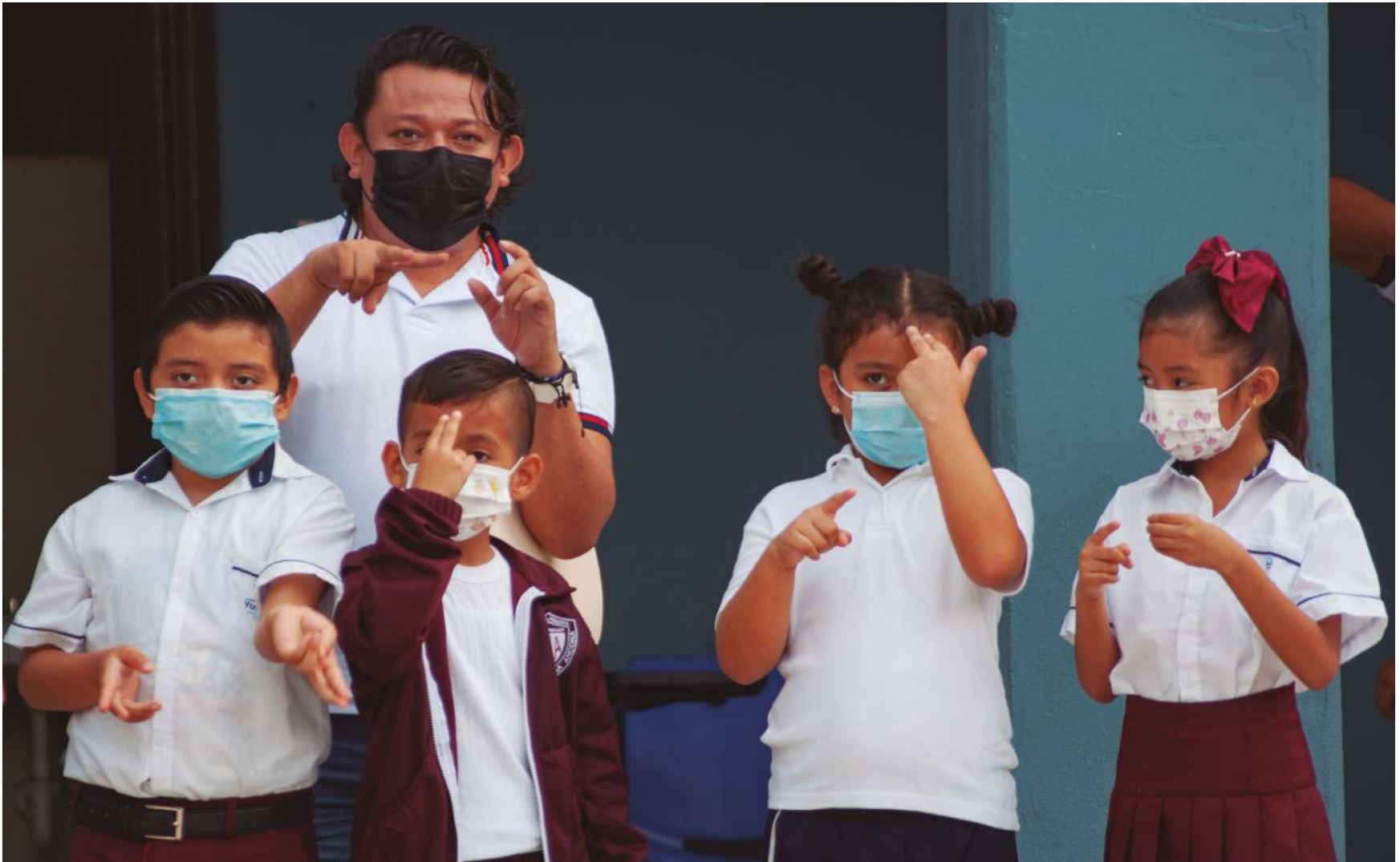
Seña: de recordar, recuerdo. Durante el homenaje a la bandera. en la Primaria "María Antonia Ancona". Junio 2022.

al personal de nuevo ingreso al servicio público educativo, bajo la responsabilidad del supervisor de zona escolar, a fin de brindar a los alumnos una educación de excelencia con equidad e inclusión.