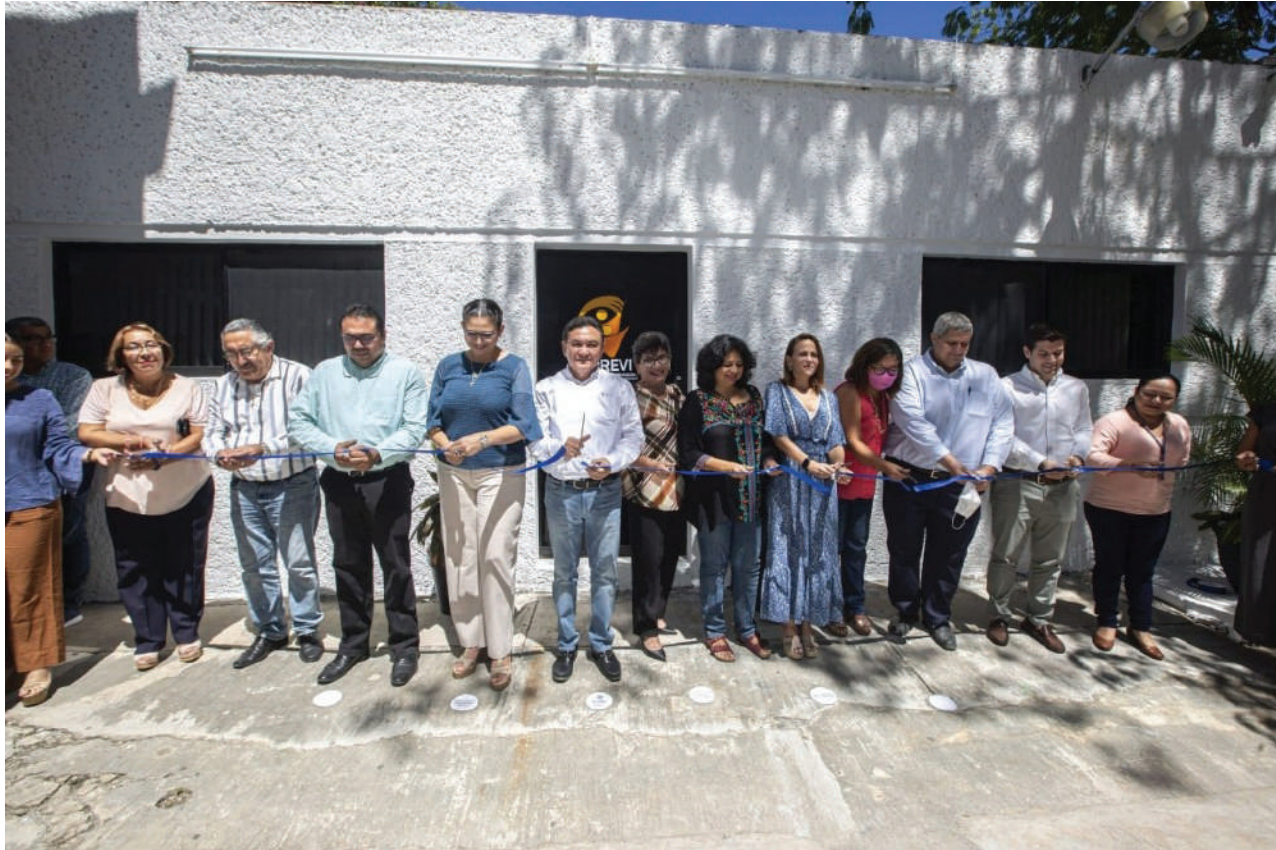
Apertura de las oficinas de la Coordinación para la Prevención de la Violencia (CPREVI).

L a violencia escolar se ha incrementado en los últimos años, varios pueden ser los factores que afectan a los niños, niñas y adolescentes para que tengan ciertos comportamientos agresivos en el entorno educativo y que se ve reflejado en su proceder hacia los compañeros y docentes. Entre los factores posibles podemos señalar el maltrato familiar, la falta de atención en casa, el exceso de videojuegos violentos, el alcoholismo por parte de mamá o papá, entre otros muchos posibles.