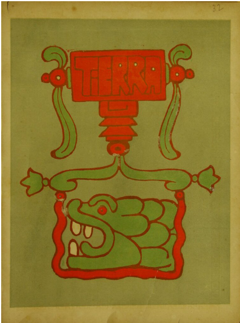
Portada de la revista Tierra , 2 de diciembre de 1923, época III, núm 32.

un hombre de fuertes ideas progresistas, pero también persuasivo para convencer a todos aquellos a los que conoció con el fin de que sigan por la senda revolucionaria. Su actuar fue caracterizado de manera virtuosa, ejemplar e impetuosa, así como libre de prejuicios y de ataduras caducas contrarias a las brisas libertarias que proclamaba en cada acción política.