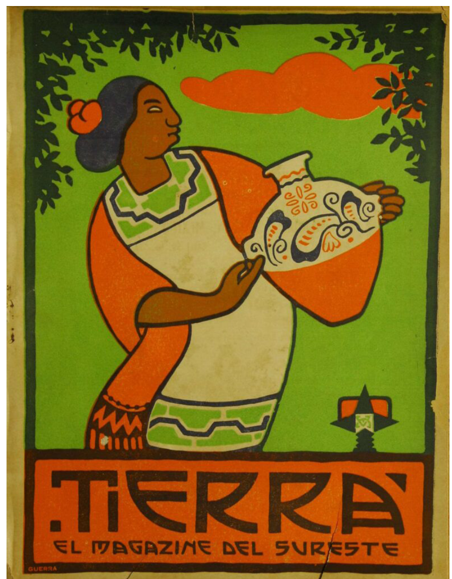
Portada de la revista Tierra , 8 de julio de 1923, época III, núm 11.

Teniendo como sitio de reunión el local de la Liga Central de Resistencia, los “Lunes Rojos”, combinaban los temas de ciencia y religión en una misma sesión, como en