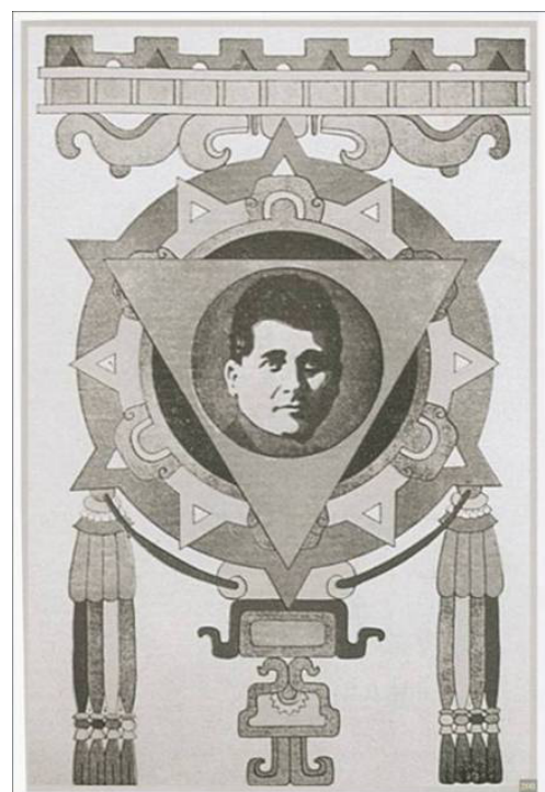
Iconografía del Partido Socialista del Sureste.

La implantación de la educación racionalista a nivel estatal, despertó una gran inquietud en los grupos más conservadores de la sociedad yucateca, quienes señalaban que el proyecto educativo era un camino hacia la anarquía y el sectarismo: “la escuela en que cada quien hace lo que le viene en gana [...] que en Yucatán producirá el efecto de una hecatombe sin precedente”. Carrillo Puerto se aprestó ante la crítica a defender la implantación del proyecto desde dos perspectivas: la social y la pedagógica. Ambas en una articulación de la ideología socialista y de la reorganización laboral: “Dos aspectos de ella conviene considerar desde luego: el social y el pedagógico. El primero, que bien podría llamarse económico, tiende a infiltrar en el alma de la generación que se levanta, con el fin de asimilarla al actual movimiento revolucionario, las causas y los efectos de la lucha de clases, el capital poseído por una clase y el trabajo suministrado por la otra.