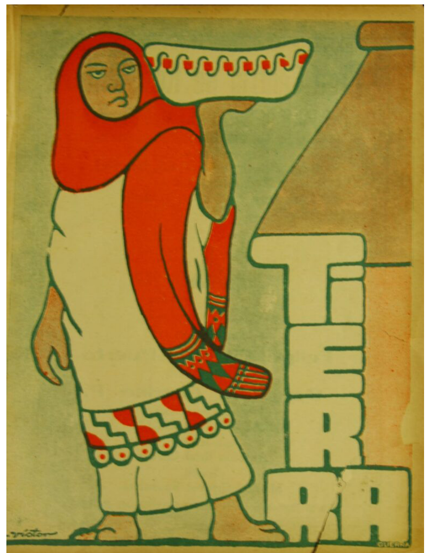
Portada de la revista Tierra , 3 de junio de 1923, época III, núm 6