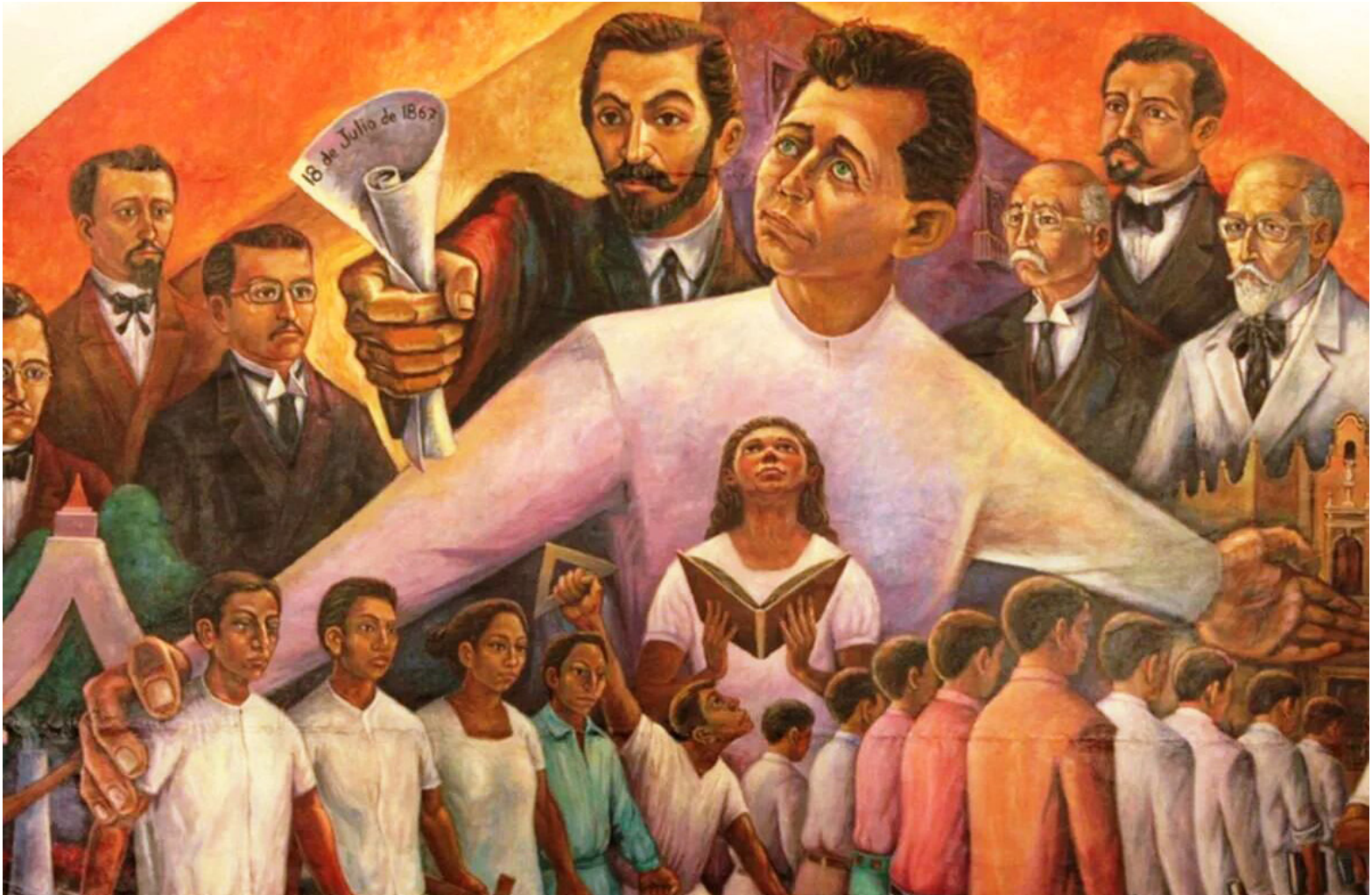
Imagen del mural "Educación Superior en Yucatán", de Manuel Lizama Salazar, fresco, 1961.