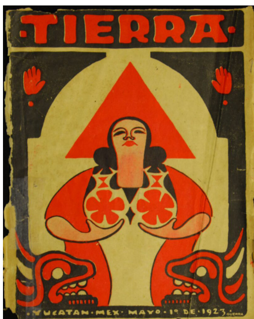
Portada de la revista Tierra, 1 de mayo de 1923, época III, núm 1.