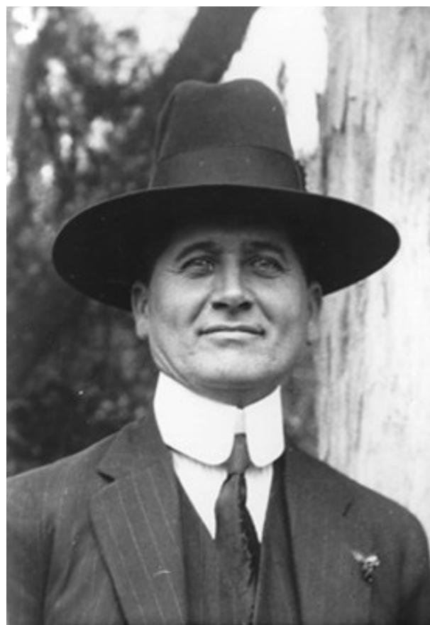
Felipe Carrillo Puerto: "El Dragón de Ojos Verdes".