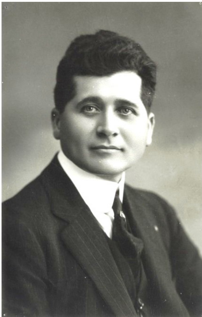
Felipe Carrillo Puerto: "Mártir del Proletariado Nacional".