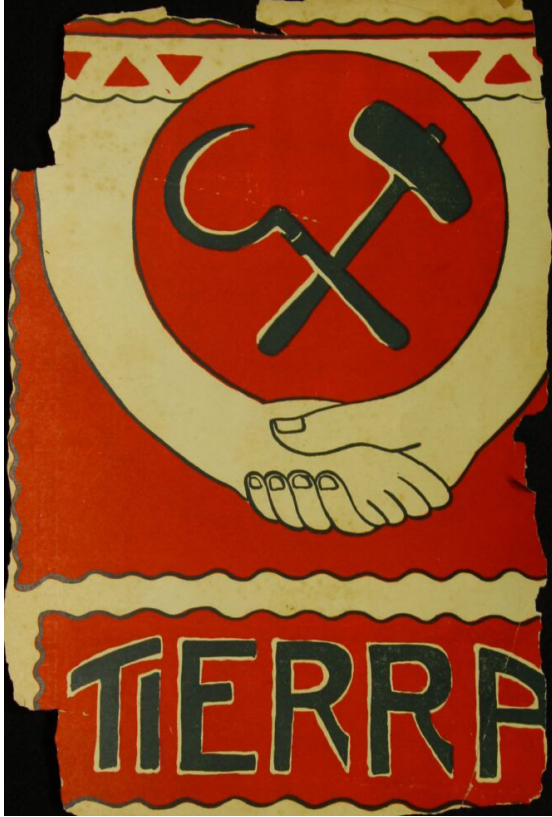
Portada de la revista Tierra , 21 de octubre de 1923, época III, núm 26.

Examinar el origen del capital conforme a la doctrina económica marxista y justificar la convicción de que la mejor justicia social que persigue el socialismo es corolario ya de postulados científicos. [...] Que la educación racional debe descansar sobre el trabajo y en la comunidad del trabajo; que, de esta manera, se alcanza mayor grado y extensión de cultura científica, moral y estética, y se ejecuta, en fin, todo en comunidad, por la comunidad, como comunidad”.