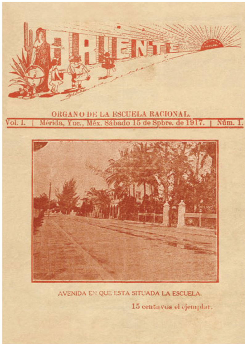
Portada del primer número de la revista Oriente, 15 de septiembre de 1917.

eran los principales recursos didácticos, se levantó una escuela activa que buscó recuperar los principios de la escuela del trabajo y que reproducía en la comunidad escolar los principios de la vida social.