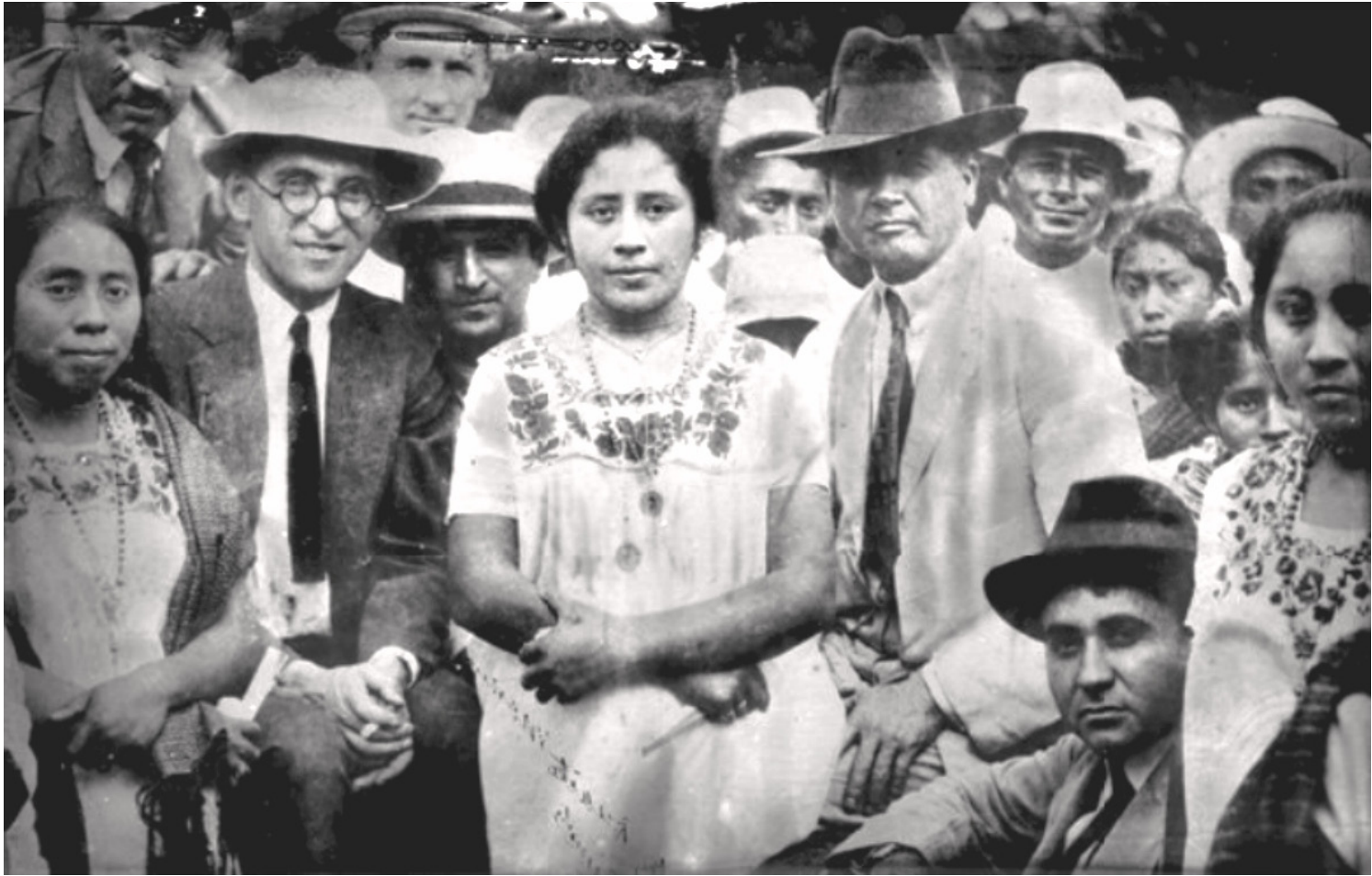
El prócer Felipe Carrillo Puerto junto al pueblo yucateco.