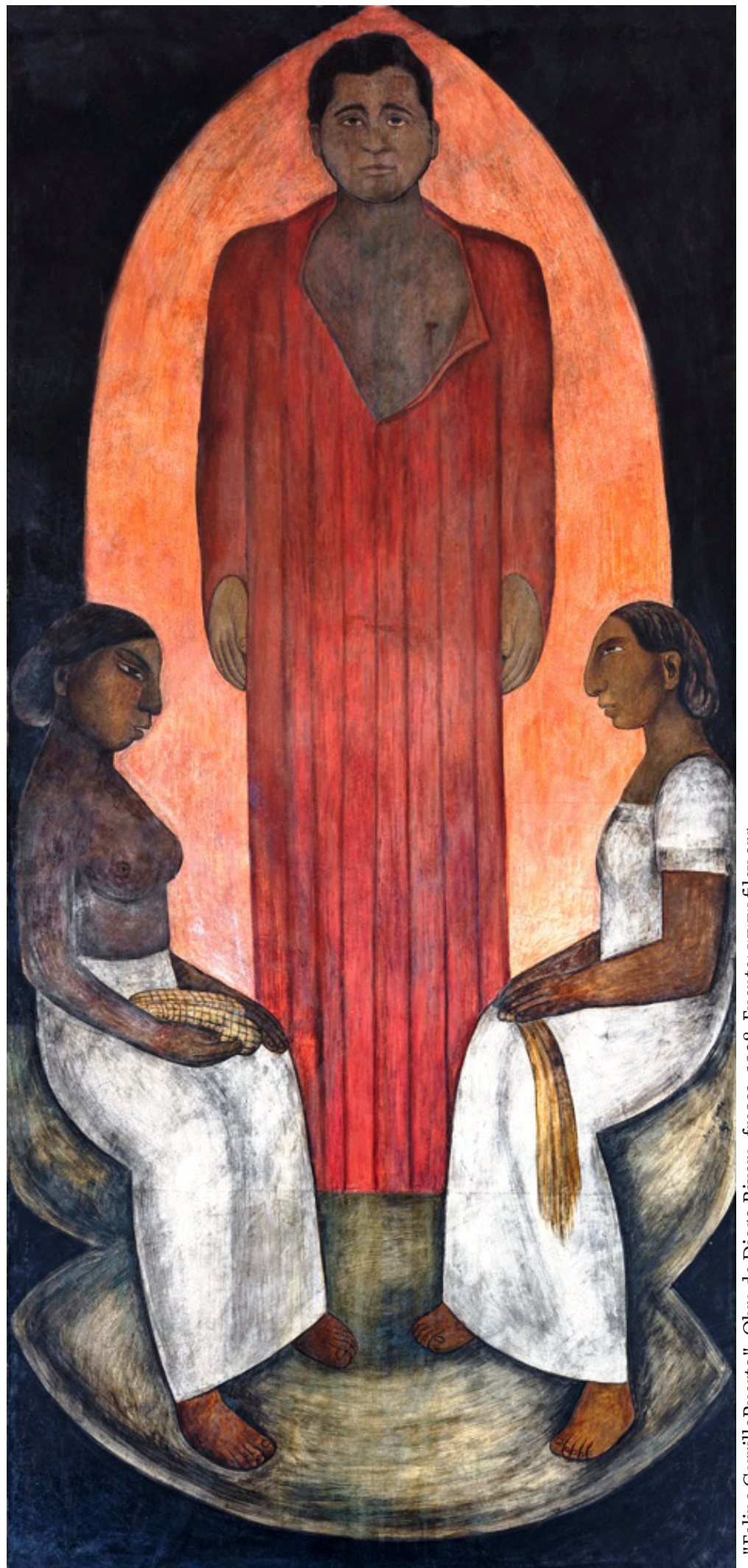
"Felipe Carrillo Puerto". Obra de Diego Rivera, fresco, 1928.