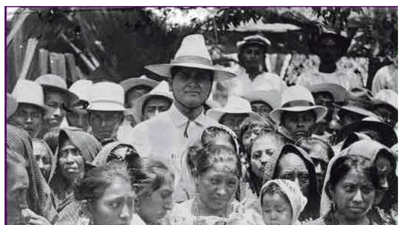
Felipe Carrillo Puerto entre trabajadores y trabajadoras de Yucatán.

En otra colaboración que salió en el Boletín de junio de 1924, “Felipe Carrillo Puerto y la educación de su pueblo”, de Fernando Gamboa, se exclamó desde el principio: “El mártir que con su sangre ha sellado el triunfo definitivo de los ideales más caros, alentó siempre en su vida de prócer insigne, el anhelo veheméntísimo del mejoramiento moral, intelectual y material de su pueblo.” Más adelante señala su carácter de apóstol, al decir: “Felipe Carrillo, como apóstol, ignoraba los alcances de la perversidad”. Esta es la imagen que se comenzó a cimentar del líder rojo desde el momento en que cayó víctima de las balas de la reacción y de la ignominia de la clase poderosa que se veía amenazada por su gobierno.