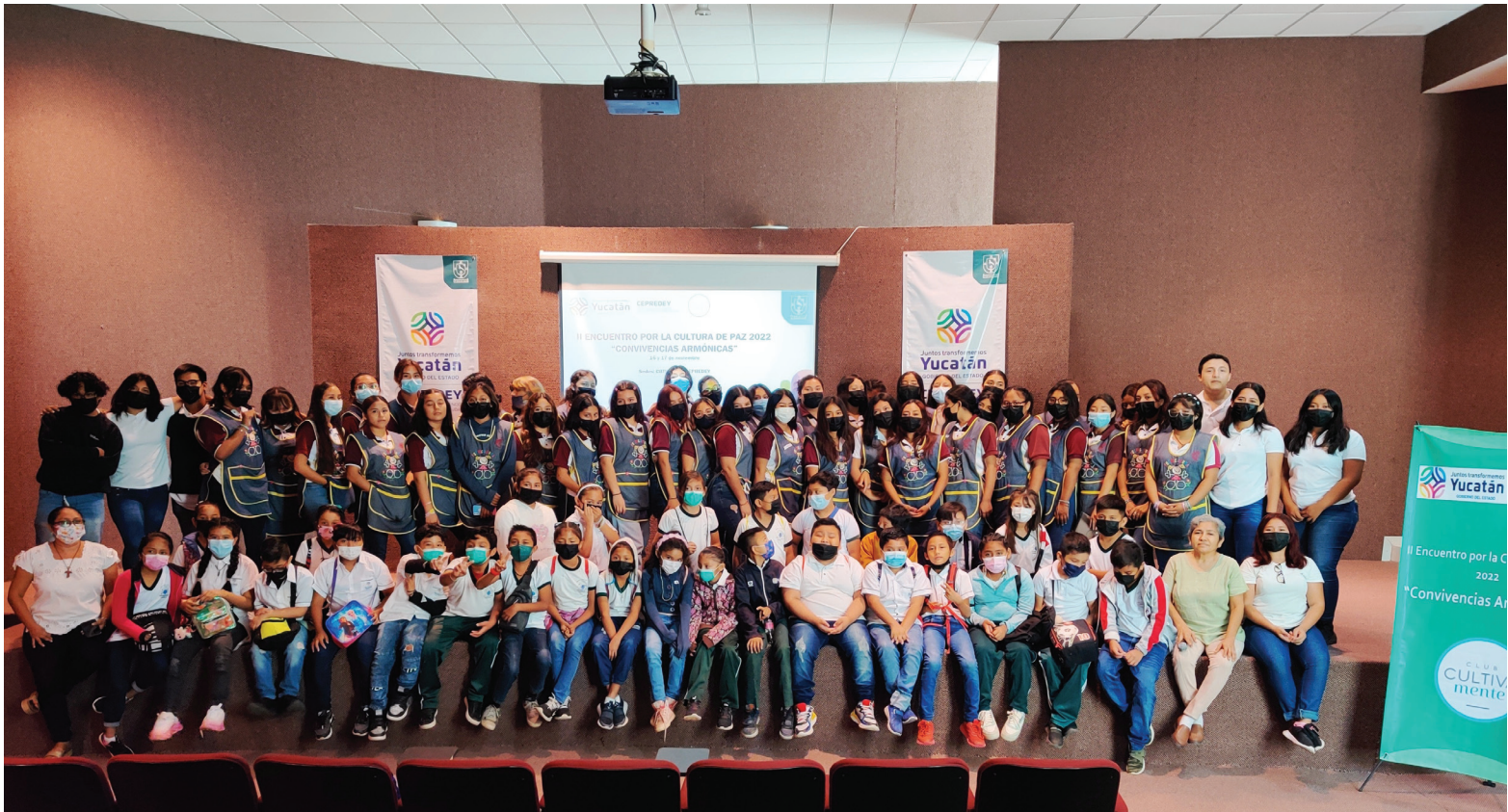
Estudiantes del 5to B y de 3ro de Puericultura con los Embajadores de la Paz al cierre de la jornada del II Encuentro.

Con agradecimiento por la invitación a colaborar en este número de Miradas al magisterio, retomaré algunos elementos significativos del proyecto “Convivencias armónicas. Aprendizajes y prácticas de prevención del delito en San Pedro Noh Pat, Kanasín”, y describiré una experiencia de creciente interés para la comunidad educativa: la convivencia armoniosa en familia. Recordarlo a un año de distancia, me ha permitido valorar aciertos y oportunidades de mejora, así como la necesidad de compartir lo que me ha parecido más significativo.