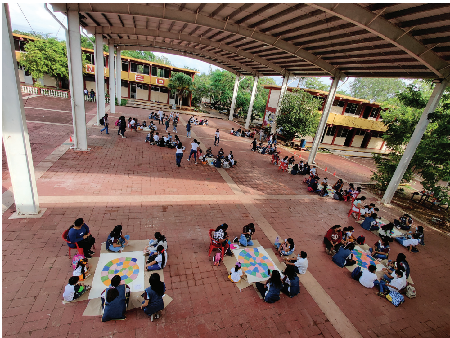
Panorámica del Juego del Caracol.

El grupo de estudiantes de Puericultura se sumó a las actividades de organización y, junto con el equipo de embajadores de la paz (nuestros prestadores de servicio social) contribuyó a la elaboración de materiales y en la coordinación de las familias conformadas para llevar a cabo el juego de roles familiares que trataré de describir brevemente.