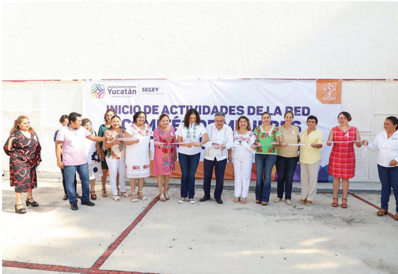
Inicio de los trabajos a través de comités escolares donde se impulsarán los derechos de las mujeres y se promoverá la igualdad de género.

La sociedad, generadora y núcleo de la armonía emocional, moral, antiviolencial, responsable de la equidad de género entre sus miembros, etc., es un estado humano deseable en todo momento y en cualquier circunstancia de la vida del hombre. Ahora bien, ¿cómo se adquiere ese grado de madurez en nuestro entorno social y familiar? Hasta el momento, la fórmula más recomendable tiene un nombre: EDUCACIÓN.