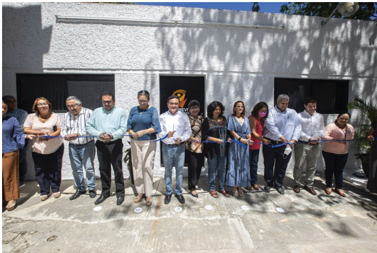
Apertura de las oficinas de la Coordinación para la Prevención de la Violencia (CPREVI).

L a violencia escolar se ha incrementado en los últimos años, varios pueden ser los factores que afectan a los niños, niñas y adolescentes para que tengan ciertos comportamientos agresivos en el entorno educativo y que se ve reflejado en su proceder hacia los compañeros y docentes. Entre los factores posibles podemos señalar el maltrato familiar, la falta de atención en casa, el exceso de videojuegos violentos, el alcoholismo por parte de mamá o papá, entre otros muchos posibles.